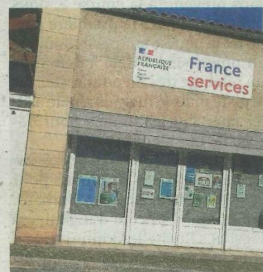
C'est au 17 rue Charles-de-Gaulle que le conciliateur tiendra ses permanences le 1er lundi du mois. N. J.