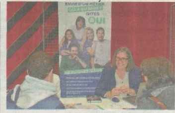
L'entreprise locale O2 service à la personne.