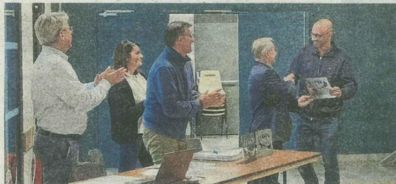
L'entreprise Isoclim de Saint-Genis-de-Saintonge a reçu le prix de la « Reconversion réussie ».