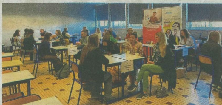
Les échanges ont apporté une grande satisfaction aux participants. P. BELTOISE