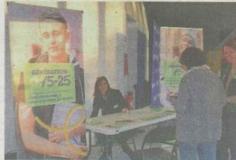
L'association de coaches Génération 15/25