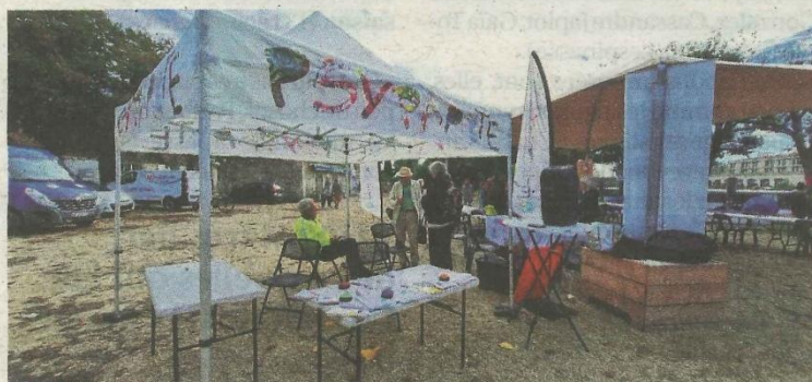
L'atelier « Psypapote » était déjà proposé lors de l'édition 2024. SIMON ALLOY