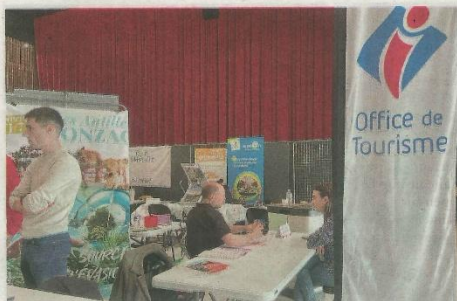
Plus de 150 visiteurs ont fait le déplacement pour ce forum des métiers du tourisme.

Au milieu de tous ces recruteurs, les Hauts-Saintongais en recherche