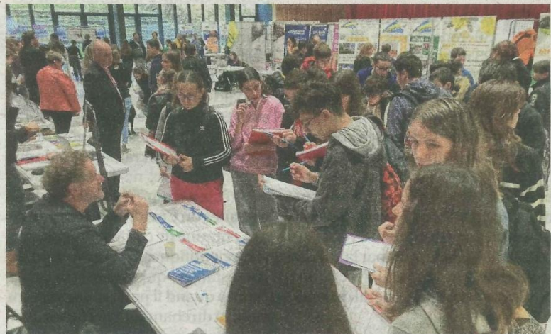
En 2024, près d'un millier de visiteurs avaient participé à la Nuit de l'orientation au Centre des congrès.