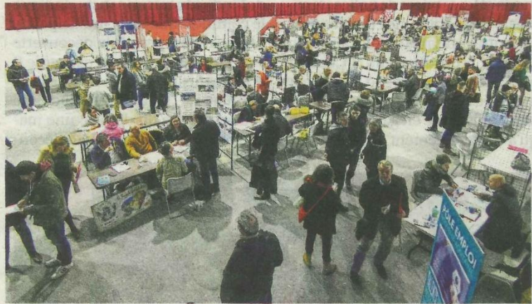
Le forum de l'emploi de Montendre se déroulera de 9 h 30 à 13 heures jeudi 15 mai.

Renseignements : 05 46 38 97 10 ou contactemploi17@charente-maritime.fr .