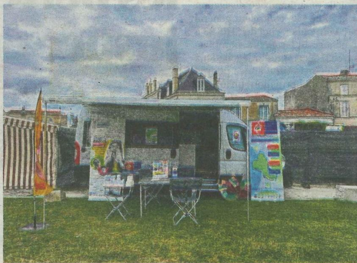
Le camion itinérant accueille le public en réalisant une vingtaine de sorties par mois. MAISON EMPLOI HAUTE SAINTONGE

Plus de renseignements et pour connaître l'agenda et les lieux de présence du camion dans les communes : 05 46 48 58 10.