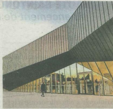
Le centre des congrès de Jonzac accueillera la deuxième édition de la nuit de l'orientation, mardi 18 novembre.

Commerce, artisanat, industrie... 130 métiers seront représentés, avec la présence de « nombreuses entreprises du bassin haut-saintongeais », précise la CCI. Plusieurs ateliers seront proposés aux jeunes, qui