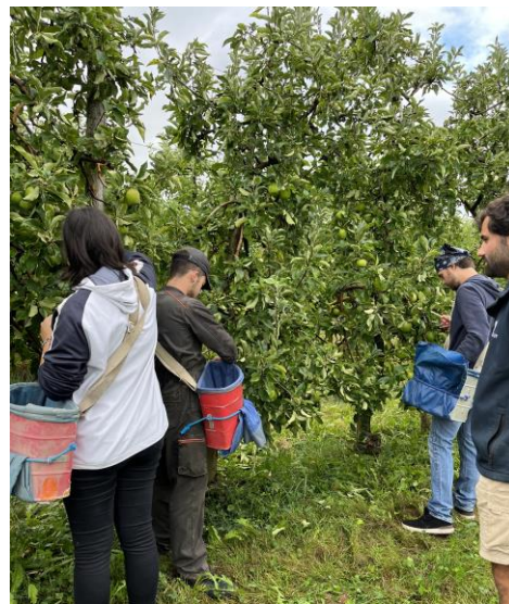
Les jeunes qui s'essaient au ramassage des pommes chez M. Faure

Plus de renseignements au 05.46.48.58.10