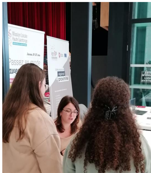
Deux jeunes à notre stand lors du forum des Formations

Plus de renseignements au 05.46.48.58.10