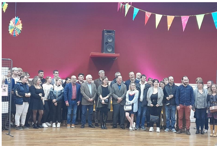
Vernissage de l'exposition à Jonzac

Plus de renseignements au 05.46.48.58.10