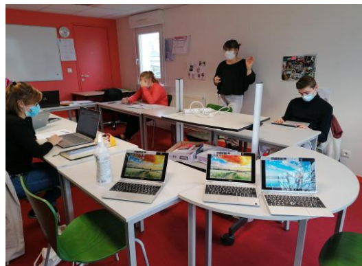
Atelier ERIP à la Maison de l'emploi

Plus de renseignements et inscription obligatoire (car places limitées) en nous contactant au 05 46 48 58 10.