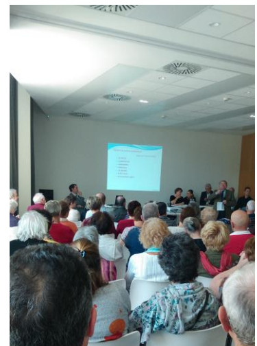
Table ronde « santé sport nutrition bien être »