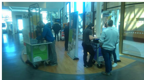
Sortie escape game