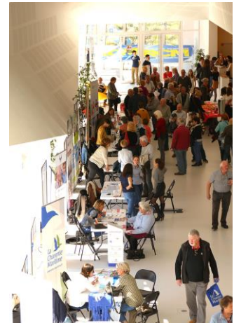
Stands des exposants lors du forum