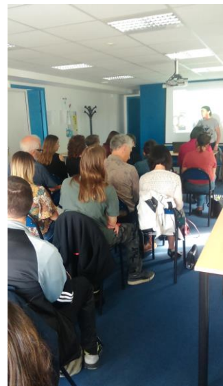
Service civique dating à la Mission Locale

Le 26 septembre, en partenariat avec la DDCS et le Centre Départemental Information Jeunesse, la Mission Locale a organisé une rencontre autour de ce dispositif à destination des structures et des jeunes intéressés. Une vingtaine de participants ont alors pu obtenir les informations nécessaires et être mis en relation sur les offres en cours.