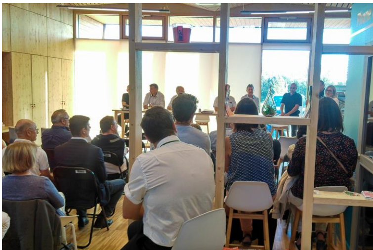
AG du club Défi Haute- Saintonge à la pépinière d'entreprises de Montlieu

Le club prépare son 10ème anniversaire le 10 Décembre au centre des congrès de Haute Saintonge où seront invités ses partenaires, les clubs d'entreprises des alentours et des entreprises de la Communauté des communes de Haute-Saintonge.