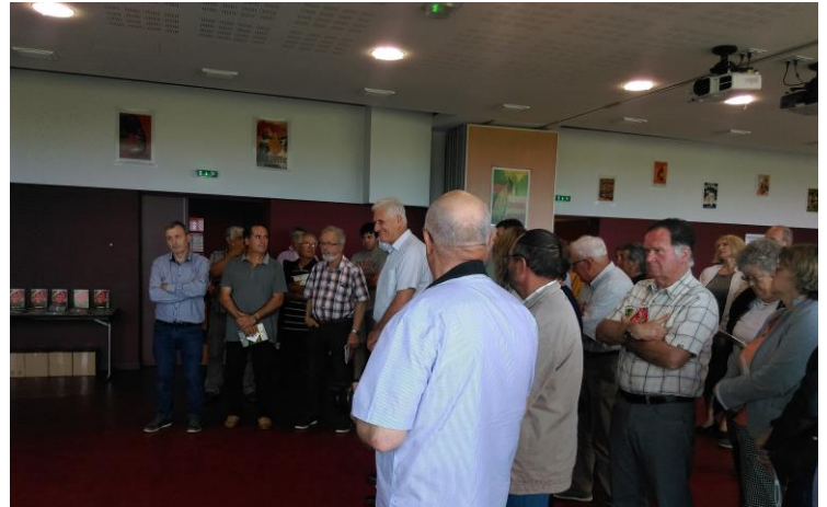
Soirée de lancement du guide le 19 juin dernier

Pour plus d'informations, n'hésitez pas à prendre contact avec nos services au 05.46.48.58.10