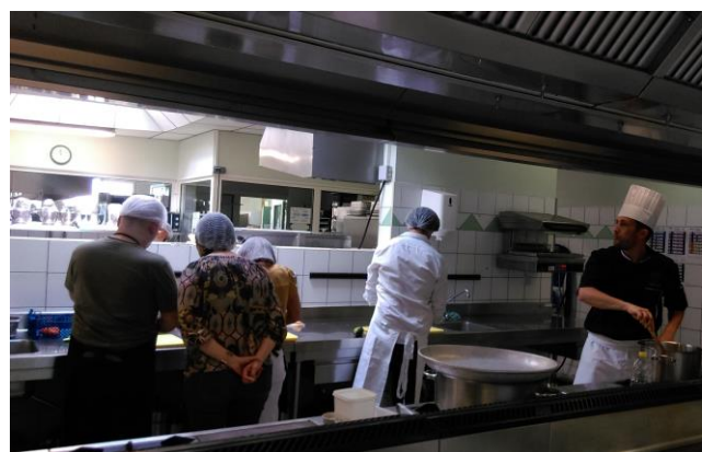
Atelier cuisine au CFA de St Germain de Lusignan

Un bilan sera effectué à l'issue de cette première session ; l'objectif final étant le retour vers l'emploi pour les bénéficiaires.