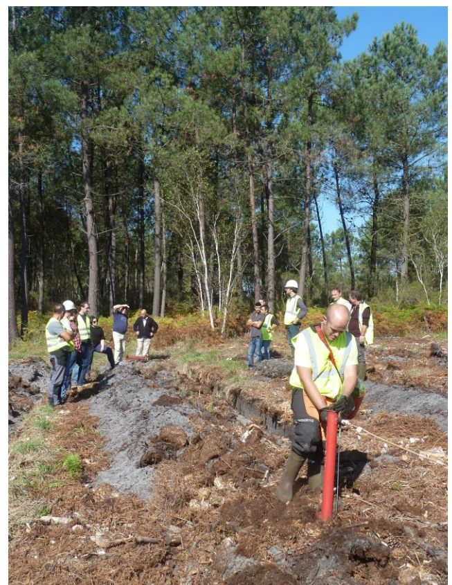
Visite d'une exploitation forestière lors d'une précédente action ERO