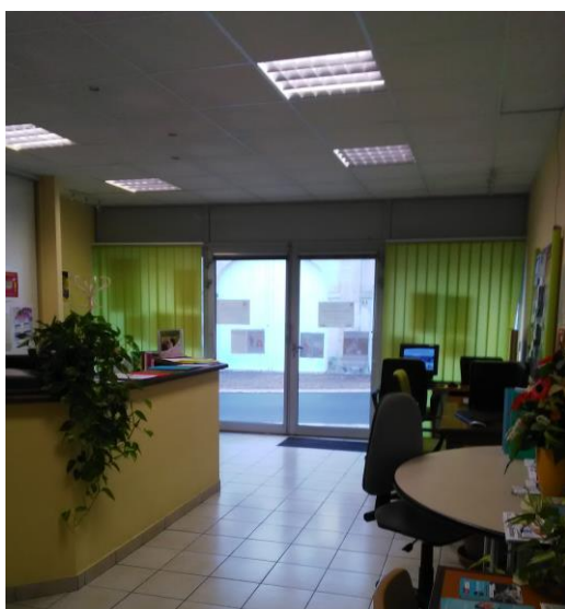
L'antenne Mission Locale au Bureau de l'emploi à Pons

Quelques chiffres de l'antenne Mission Locale de Pons depuis Mars : - 95 jeunes accompagnés, soit plus de 300 entretiens individuels - 58% de femmes - 18% de mineurs - 40% de jeunes non diplômés