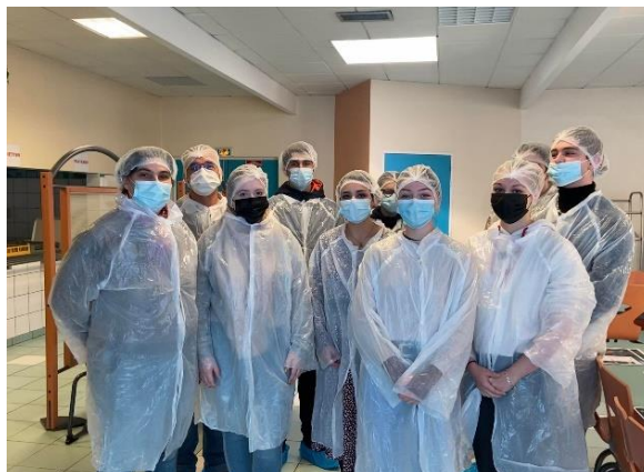
Visite du CFA-CMA17 à St Germain de Lusignan

Parmi les solutions mises en œuvre, 60 jeunes ont signé un contrat en alternance, 58 sont entrés en emploi, 5 se sont engagés en service civique, 57 sont entrés en formation, 66 ont fait des immersions en entreprise, 26 sont en scolarité, les autres étant accompagnés dans le cadre du PACEA (Parcours Contractualisé vers l'Emploi et l'Autonomie) avec leur conseiller Mission Locale.